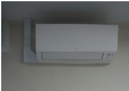
Installation de 7 appareils de climatisation réversible dont 2 ont été pris en charge par la mairie et le reste à la charge de la Chesnaye. Cette intervention répondait à l'obligation de climatiser les locaux communs au sein d'une maison de retraite. C'est l'entreprise Fluzat d'Ainay le Château qui est intervenue.