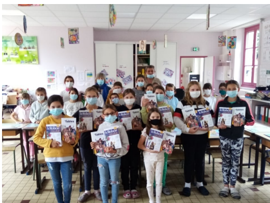
Remise des dictionnaires

Huit élèves du CM2 ont reçu un dictionnaire offert par la Communauté de Communes pour leur entrée en sixième et un livre sur les fables de la Fontaine offert par l'éducation nationale.