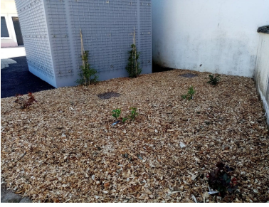
Plantation de rosiers derrière le WC public par Patrick