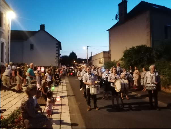
14 août 2021 Retraite aux flambeaux avec la fanfare l'Indépendante d'Ainay le Château