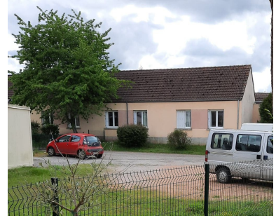
Changement des huisseries à la maison de retraite par l'entreprise COURTIS - 6 portes-fenêtres - 41 fenêtres - 2 portes de services