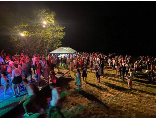
15 août 2021 Bal organisé par l'Association Tronçais Nature et Traditions

La municipalité remercie toutes les personnes qui ont participé à l'organisation de ce merveilleux week-end du 15 août :