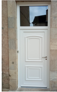
Changement de la porte d'entrée du logement de la maternelle par l'Entreprise COURTIS