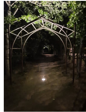
Réparation et changement des spots dans l'Allée François Terrasson par l'Entreprise CEE : - renouvellement de l'armoire d'éclairage public - dépose des 10 encastrés existants - fourniture et pose de 10 encastrés de sol. Coût pour la commune : 3234,00 €