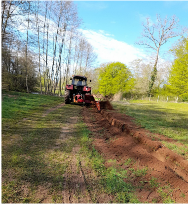
Nettoyage des petits étangs. Un grand MERCI à tous les participants