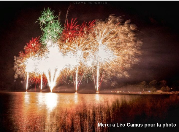
Feu d'artifice par la société 2B événement