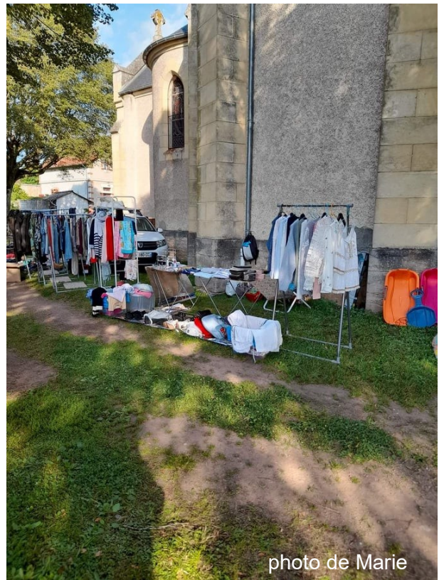
15 août 2021 Brocante